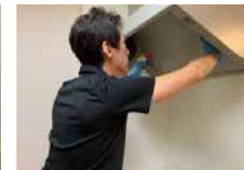
キッチンや浴室、トイレのクリーニングは勿論、お庭の草刈りや庭木剪定、高所作業等も承ります。