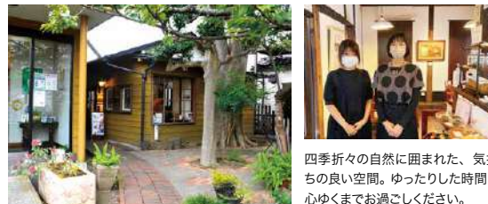
四季折々の自然に囲まれた、気持ちの良い空間。ゆったりした時間を心ゆくまでお過ごしください。

光と色彩が織りなす美しい世界「笹倉鉄平版画ミュージアム」に併設するカフェ。店内にも版画を展示しており、庭の景色と共に楽しみいただけます。特典は人気の「自家製チキンカレーセット」。ネスカフェミラノのコーヒーやオリジナルブレンドのハーブティー、自家製ジンジャーエールやレモネード、鎌倉ビールなどもおすすめです。