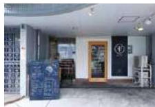
感染対策をして営業していますので、お気軽にお立ち寄りください。

★最新の営業状況は店舗にご確認下さい。 ★ランチタイムは上記特典をご利用いただけません。