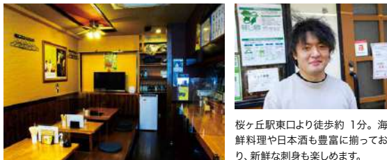
桜ヶ丘駅東口より徒歩約 1分。海鮮料理や日本酒も豊富に揃っており、新鮮な刺身も楽しめます。

いわゆる居酒屋料理でもイタリアンでもない、店主だからこそ生み出せる 2つのいいとこ取りの料理が人気。イタリアンシェフだった頃からのツテで信頼がおける卸業者から仕入れるお肉は、牛、鶏、豚どれも極上の素材です。特典は希少部位、黒毛和牛のイチボのステーキ。赤字覚悟の逸品を、この機会に是非味わってみてください。